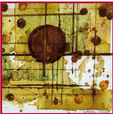
RUHR GALLERY/Galerie an der Ruhr Kunstaussstellung des Mülheimer Künstlerbundes

Schloßstraße 17 45468 Mülheim an der Ruhr